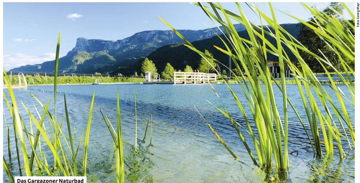
Das Gargazoner Naturbad

Im Gegensatz zu konventionellen Bädern sind Naturbäder wie jenes in Gargazon als Ökosysteme zu verstehen, in denen ähnliche Prozesse wie in natürlichen Seen ablaufen. Durch den Verzicht auf fossile Wärmeerzeugung für das Badewasser trägt das Naturbad auch wesentlich zur Verbesserung der CO 2 -Bilanz bei. Ein weiteres Plus aus ökologischer Sicht ist die Nutzung der Sonnenenergie für die Beheizung des gesamten Duschwassers im Naturbad. Ebenso nachhaltig wie das Bad selbst ist auch seine Erreichbarkeit, so ist das Na-