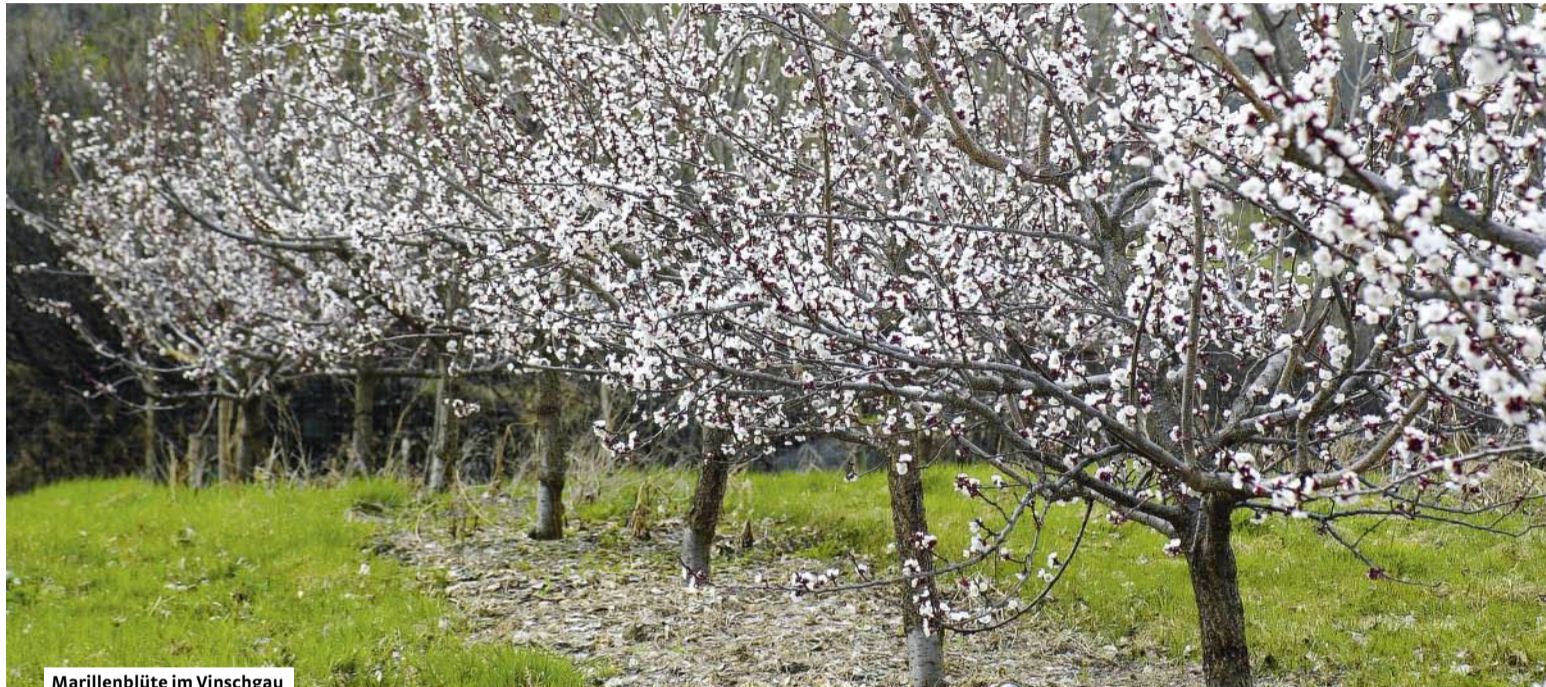
Marillenblüte im Vinschgau

Das besondere Steinobst prägt wieder verstärkt das Bild der Vinschger Kulturlandschaft